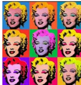
Andy Warhol, Marilyn.

Pop art ou arte pop foi um movimento, surgido principalmente nos Estados Unidos e na Inglaterra, na década de 1950, que utilizava elementos, figuras e a própria estética popular em seus trabalhos, de maneira a fazer uma crítica direta e irônica da sociedade consumista que se formava naquela época, especialmente com a popularização da televisão.